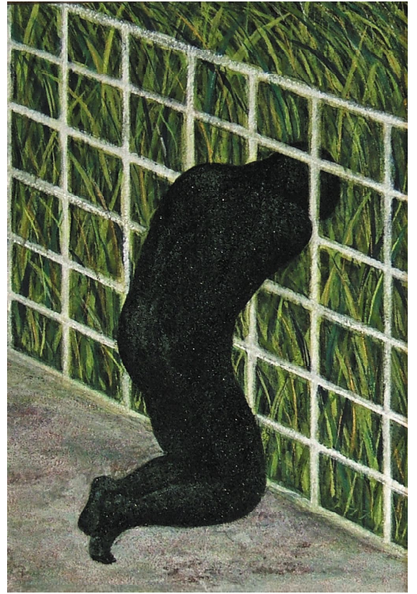
見谷 カラス MITANI kalasu