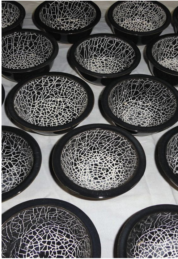
金子 愛 KANEKO ai